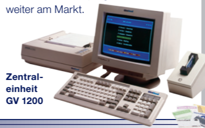
Zentraleinheit GV 1200

Mit der Entwicklung kontaktbehafteter Chipleser mit schneller Schreib-Lese-Routine und der Zentraleinheit GV etabliert sich das junge Unternehmen weiter am Markt.