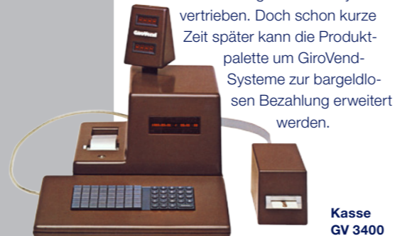
Kasse GV 3400

Das Unternehmen mit Hauptsitz in Dortmund und Niederlassungen in Berlin, Hamburg, Hannover, Köln und Stuttgart ist spezialisiert auf die bargeldlose Bezahlung in der Gemeinschaftsverpflegung mit innovativen und ganzheitlichen Systemlösungen sowie auf Zeiterfassungs- und Zutritts-Kontrollsysteme.