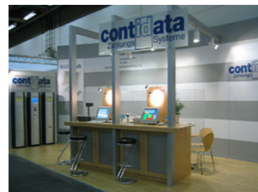
Messestand auf der INTERNORGA

Mit Beginn des neuen Jahrtausend ist contidata ab sofort jedes Jahr auf der Fachmesse INTERNORGA in Hamburg vertreten. Am eigenen hochmodernen contidata-Stand werden allen Kunden und Interessenten die aktuellsten Entwicklungen im Bereich der bargeldlosen Zahlungssysteme präsentiert.